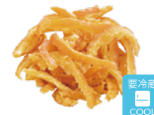
伊予柑スティック