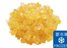
4mm 柚子カット HS (1kg×7袋)×2箱

当社が持ちうる技術と経験を最大限に盛り込んだ商品シリーズです。 香料や洋酒をあえて使用せず、本来の香気成分を最大限に引き出す製法と、 従来の柑橘加工品にはなかったフレッシュ感を全面に押し出した最上級の商品となります。