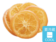
オレンジ輪切クリスタル