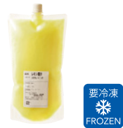
レモン果汁 (100%ストレート)