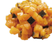
7mm・10mm・15mm カボチャダイスカット