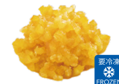
4mm 伊予柑カット HS (1kg×7袋)×2箱