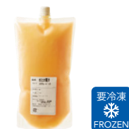
せとか果汁 (100%ストレート)