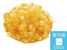
まるごとオレンジ 4mmカット