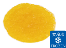
生柚子ペースト (加糖・無糖)