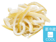
レモンスティック