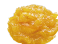
伊予柑ママレード