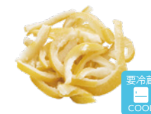
日向夏スティック