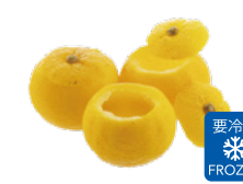
花ゆずカップ (無糖)