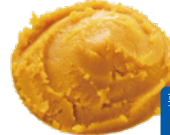
カボチャペースト （加糖・無糖）