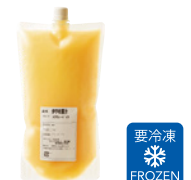
伊予柑果汁 (100%ストレート)