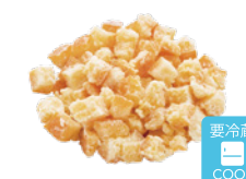
7mm伊予柑 クリスタル