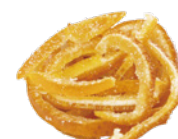
甘夏柑スティック