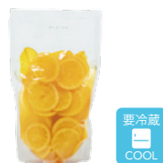
オレンジスライス 袋タイプ