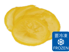
冷凍柚子スライス輪切