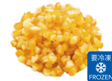
4mm オレンジカット HS (1kg×7袋)×2箱