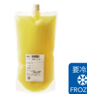
日向夏果汁 (100%ストレート)