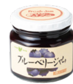
ブルーベリージャム