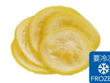
日向夏スライス輪切M