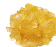
羊羹用柚子スライス