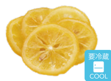
レモン輪切クリスタル