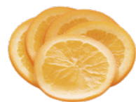
オレンジスライス

温暖な気候の中で穏やかな日光を十分に浴び、キレのあるすっきりとした香りが特徴です。