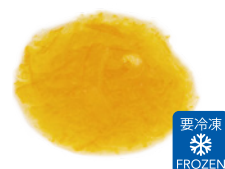
味噌用スライス 生柚子ペースト