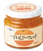
いよかん マーマレード