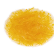
柚子スライスママレード