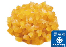
4mm 甘夏柑カット HS (1kg×7袋)×2箱