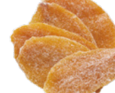
柿スライスドライ