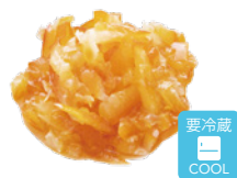
まるごと オレンジスライス