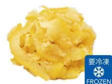
冷凍柚子スライス