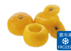
花ゆずカップ (加糖)